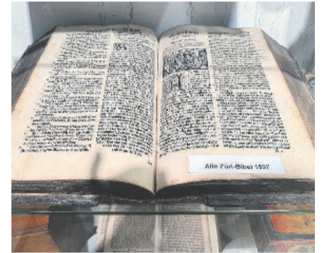
Besonders wertvoll: die Züri-Bibel von 1597.