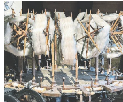
Eine Seidenwinde aus dem Jahr 1880.