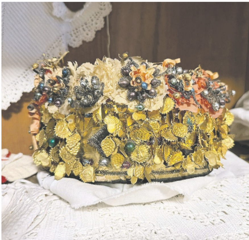
Dieses Schmuckstück ist eine sogenannte Brautkrone und wird im Museum sicher verwahrt.