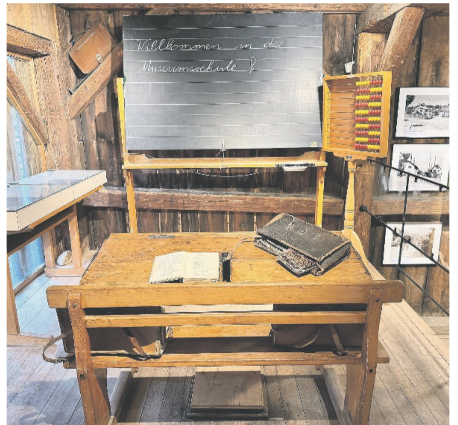
Das Lernen in digitalen Zeiten war da noch kein Thema: So sah ein Schulzimmer ca. 1900 aus.

In diesem Zusammenhang stellte er folgende Frage: «Wussten Sie übrigens, weshalb wir sagen «Ein Buch aufschlagen»? Um dies zu illustrieren, zeigt er auf